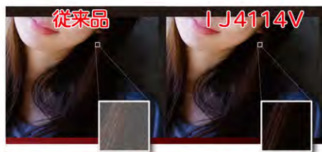
シルバリング(白化現象)を抑制!