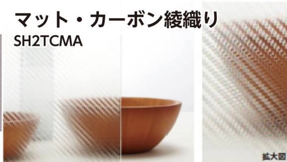
マット・カーボン綾織り SH2TCMA