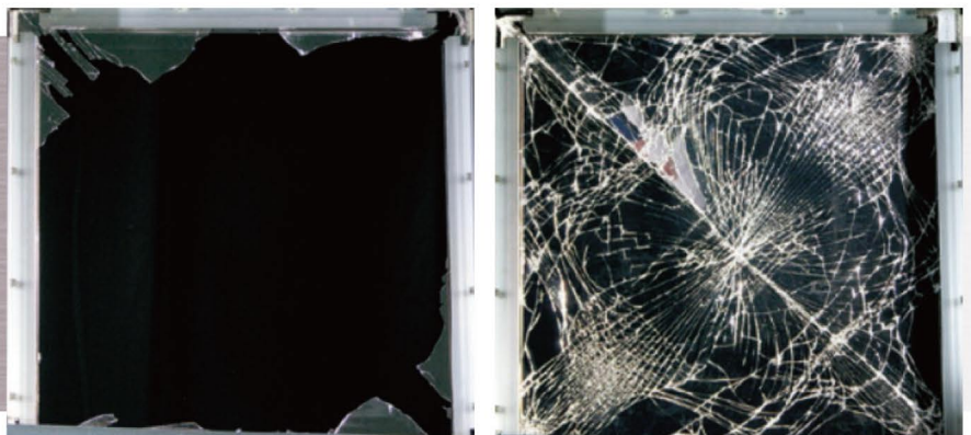
地震などを想定した層間変異試験 (左：ガラスのみ、右：飛散防止フィルムを貼付)

フロスト・エンボスパターンシリーズ / カラードシリーズは、JIS A 5759 の飛散 防止フィルムの規格を満たす飛散防止 性能を持ちます。万が一地震などの災害 時にガラスが割れても、破片が飛び散ら ず、鋭いガラス片によるケガを防ぎます。