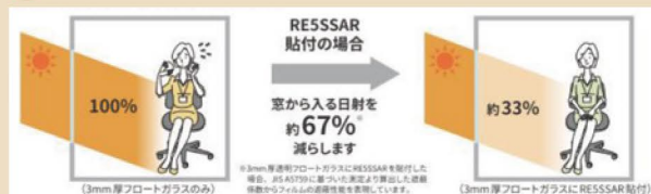
真夏のジリジリ焼ける不快な暑さをカット!