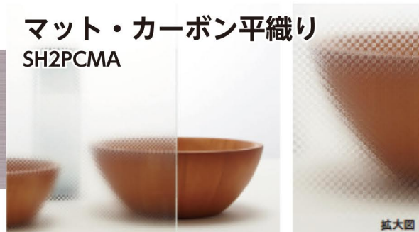
マット・カーボン平織り SH2PCMA