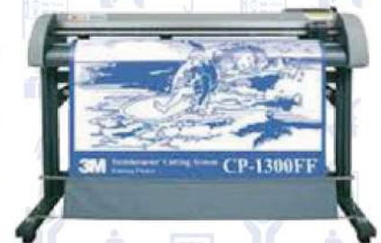
グリッド式カッティングプロッター