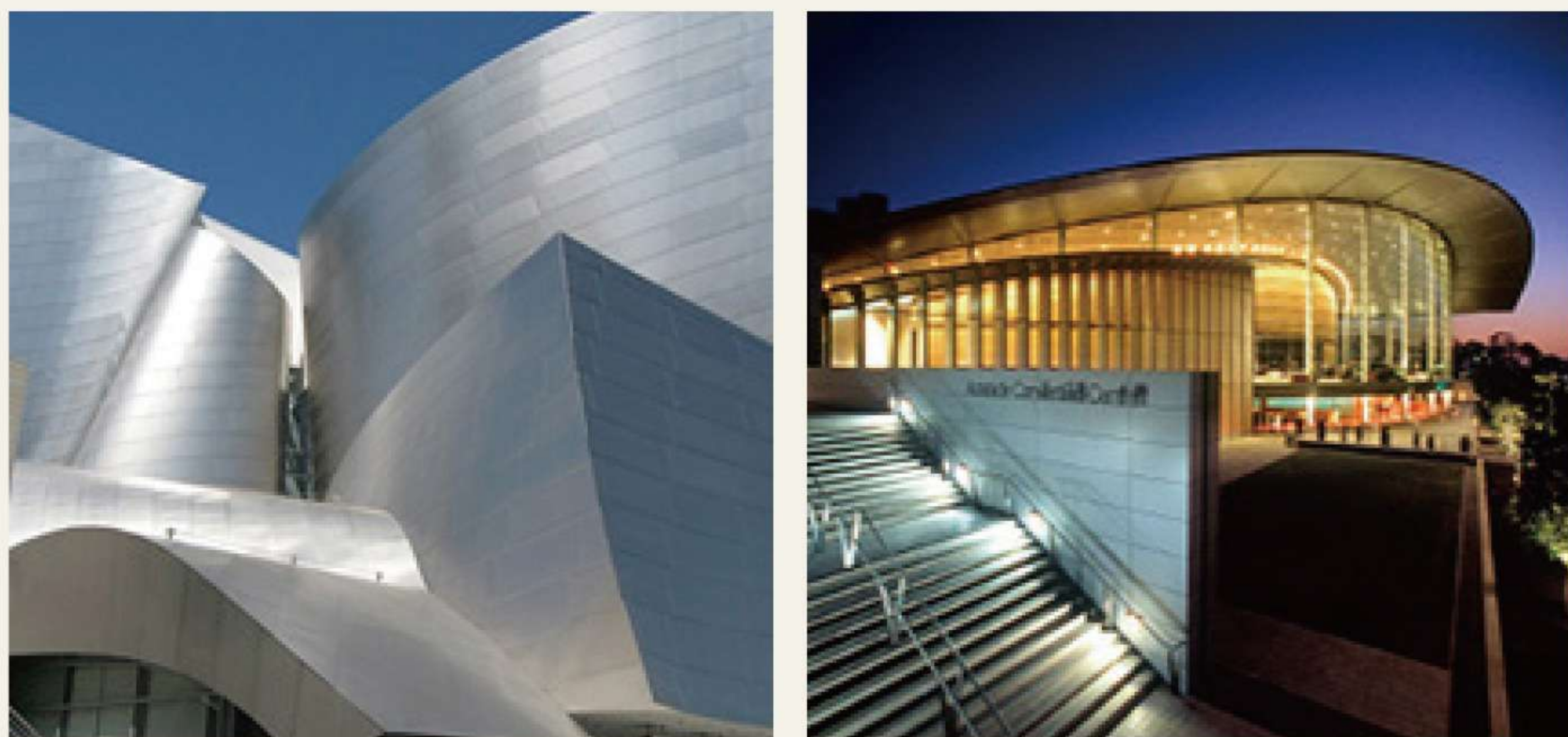
製品情報については、厚みと幅と数量をご確認の上、お問合せください。