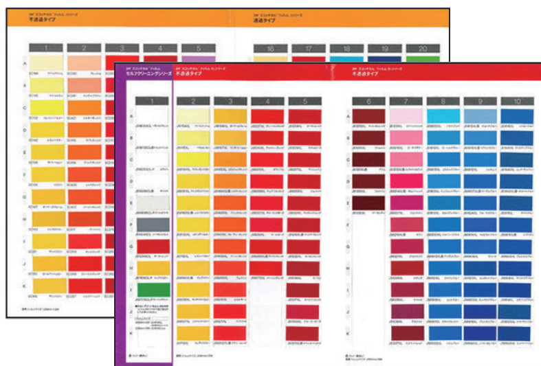
サンプル帳中身見本