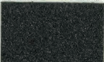
SV3160 (ライナー付) サイズ: 600mm×10m

用途 路面のクラック、簡易補修、ジョイント部の段差修正・スリップ防止・補修箇所の保護、道路標示の一時的マスキング