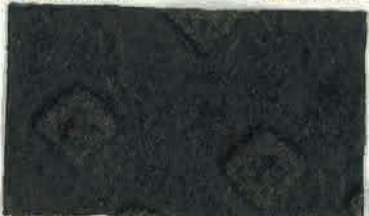
L715 (ライナー付) サイズ: 610mm×5m 610mm×22.8m

用途 路面のクラック、簡易補修、ジョイント部の段差修正・スリップ防止・補修箇所の保護、道路標示の一時的マスキング