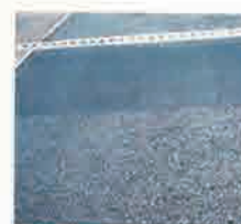
ジョイント部の段差修正