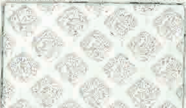
L270ES (ライナー付) サイズ: 150mm×22.8m 610mm×22.8m