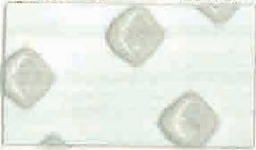
A710 (ライナーなし) サイズ: 150mm×27.4m 200mm×27.4m