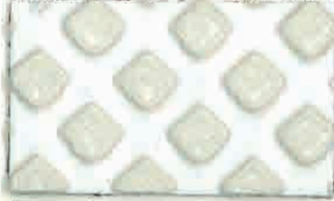
L380AW (ライナー付) サイズ: 150mm×22.8m 610mm×22.8m