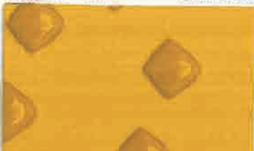
A711 (ライナーなし) サイズ: 150mm×27.4m 200mm×27.4m

強靱なネット層の構造を持ち、設置強度と作業性に優れています。特に、撤去時の材料破断を抑え作業時間が短縮できます。また、2種類の屈折率のガラスビーズを使用することにより天候を問わず、高い視認性を確保することができ、安全面での対策にも優れた製品です。主に外側線用に適しています。