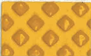
L381AW (ライナー付) サイズ: 150mm×22.8m 610mm×22.8m

3M™ 独自の超硬・超高屈折率セラミックビーズ技術により、乾燥・降雨の状況を問わず、優れた反射効果を発揮する路面標示材です。