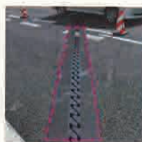
ジョイント部の滑り止め