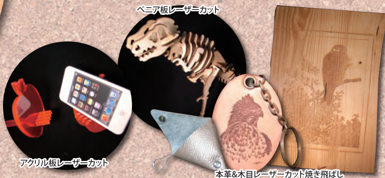
亚克力レーザーカット