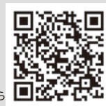
製品説明書はこちら

※ M21、BR120 の屋外耐候性は約 1 年です。自動車への使用は推奨しておりません。 ※ 耐候性の数値は弊社試験結果に基づく予想される年数であり、保証年数ではありません。 ※ 施工方法や使用環境により、この値より短くなる場合があります。